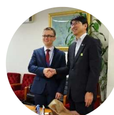
Визит вежливости к мэру города Нагасаки господину Тауэ