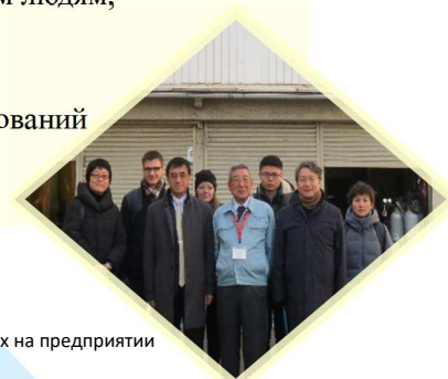
В гостях на предприятии