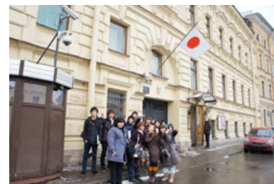
在サンクトペテルブルク日本国総領事館前で

しかし日本とロシアの国民感情の温度差は大きく、ロシア国民は半数以上も日本に親しみを感じてくれているにもかかわらず、日本国民は大半がロシアに親しみを感じていないことがわかりました。これは日本とロシアにとって大きな問題です。その原因の一つは、日本の教育が関係しているのではないだろうかと考えました。日本人はロシアに対してあまり勉強することはないし、言語を学ぶ機会も少ない。学校の授業でロシアについて取り上げられることといえば北方領土かチェルノブイリ原発事故くらいで、ロシアのマイナス面ばかりを学んできたように思います。今後の日本ではロシアについてプラス面の教育もすべきだろうと強く感じました。