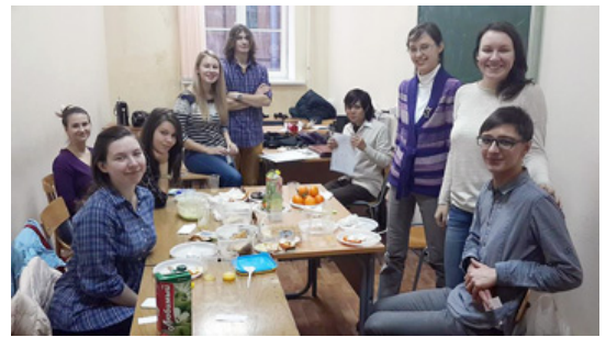
クリスマスパーティー/忘年会の様子

お歳暮の授業の様子。実際にお世話になったクラスメイト同士でお歳暮を購入し、のしを貼って交換しました。