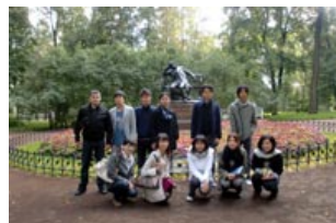
詩人プーシキンの像の前で。

サンクトペテルブルクのキエフスカヤ・ホテルでの朝食後、バスでプーシキン市視察へ向かいました。