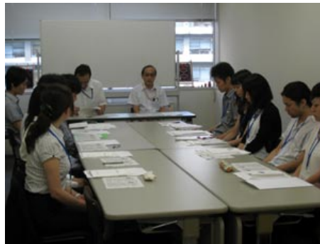
事前勉強会(2010年8月26日。於外務省)

本プログラムは、ロシア連邦青年問題局より提案され、「文学を含むロシア文化に関心を有する日本人青年がロシア古典文学の生活及び作品に関連する場所を訪問する」という内容で策定されたプログラムです。当センターの公募によりロシア古典文学に精通した10名の日本人青年を派遣しました。