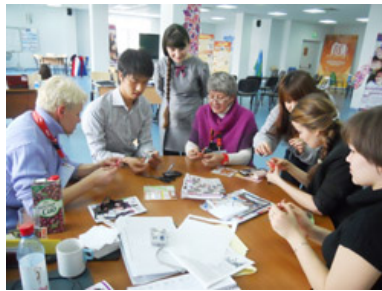
折り紙を教える様子

天候にも恵まれ、雪に包まれたその街並みにはただ感動するばかりでした。とにかく自然が素晴らしく、太陽に照らされた白樺と雪はこれまでに見たことのない美しさ。街の中心に位置する大きなツリーと氷のオブジェと滑り台には圧倒されました。近くにある教会も見どころの一つでした。ハンティマンシスクは、ここ数年でかなりの発展を遂げたと言っただけあって、建物など街並みが近代的でしたが、この教会を目にするたびに、ここはロシアなのだということを感じずにはいられませんでした。人もとても親切で自然も最高、ただ感動するばかりで、すぐにこの街に魅了されました。