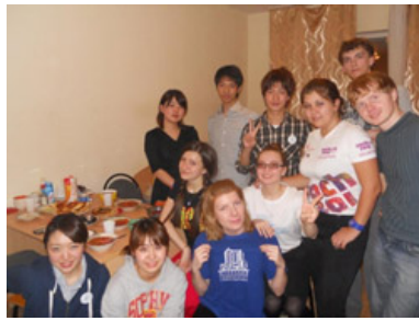
学生寮での交流の様子

市内見学では、美術館や博物館・原住民の生活を展示した場所を訪れ、ハンティマンシスクの歴史を学びました。アイヌ族がかつてここに住んでいたと考えられていることや、ハンティ族やマンシ族の生活の様子をガイドさんの案内とともに学び、彼らの知恵や工夫をこらした暮らしぶりが非常に興味深いものでした。