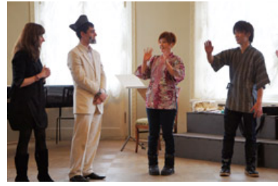
「ロシアからの船～プチャーチンと伊豆の人々」

日本側からの日本文化紹介は、「ロシアからの船～プチャーチンと伊豆の人々」という日露合同劇と、いろはかるた、茶道、しりとり、ダンス、歌。合同劇ではロシア人学生と練習する機会が全くなかったので不安でしたが、ロシア人学生のセリフの時には、手でセリフの出だしを合図するなどの工夫をして、何とかうまくいきました。