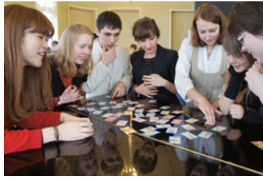
いろはかるたに挑戦！