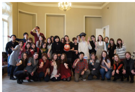
国立文化芸術大学のみなさんと

日本大学国際関係学部安元ゼミナールは、日露交流研究や日本文化を研究テーマに活動を続けています。毎年春休みに実施してきたロシア研修も8回目となり、今回は日露青年交流事業「日露学生文化交流プログラム」として実施しました。ロシアでは一般的な小中高一貫教育 校訪問、大学訪問、ロシア人家庭訪問、学生との交流を通じて、異文化交流を体験してきました。