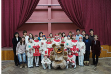
ロシア民話のミュージカル