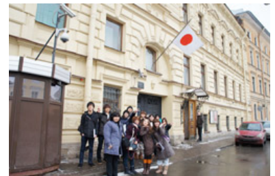
在 Санкт-Петербург 日本国総領事館前で

しかし日本とロシアの国民感情の温度差は大きく、ロシア国民は半数以上も日本に親しみを感じてくれているにもかかわらず、日本国民は大半がロシアに親しみを感じていないことがわかりました。これは日本とロシアにとって大きな問題です。その原因の一つは、日本の教育が関係しているのではないだろうかと考えました。日本人はロシアに対してあまり勉強することはないし、言語を学ぶ機会も少ない。学校の授業でロシアについて取り上げられることといえば北方領土かチェルノブイリ原発事故くらいで、ロシアのマイナス面ばかりを学んできたように思います。今後の日本ではロシアについてプラス面の教育もすべきだろうと強く感じました。