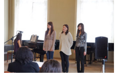
ロシア人学生による俳句の暗誦

ロシア人学生は常に日本語を使って交流してくれました。スピーチは「文化交流は自国の文化への関心も深める有意義なもの」という主旨で、日本人の演じたソーラン節を見て、ロシアの狩師の歌や踊りを知らないのそのことについて関心を持ち、調べてみようと思ったという内容であり、交流会の原点である、互いの考えを知るということ思い起こさせてくれたすばらしい内容でした。