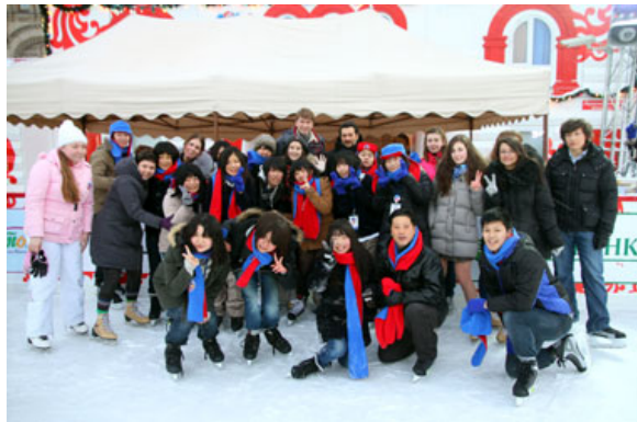
「赤の広場のスケートリンクで、おそろいのマフラーと帽子を着けて。」