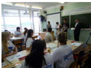
マンガワークショップの様子