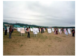
日本アニメ・マンガ専門学校学生作品展示