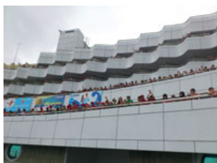
オケアンにて大歓迎を受ける訪問団

10～17歳の優秀な子供達がロシア中から集まって団体生活を送る施設で、マンガ教室及びB1作品パネル展示を実施しました。Gペンの使い方、ベタぬり、スクリーントーンの使い方を中心にしたワークショップは、好評だったため時間を延長しました。そのあとオケアンの学生によるコンサートを鑑賞しました。