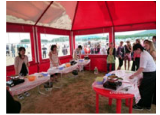
突然、調理実習でロシアのスープを作ることに