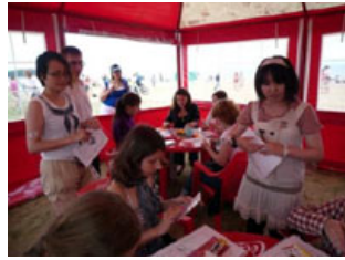
ワークショップにはコスプレショーの出演者も参加