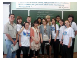
参加者のみなさんと