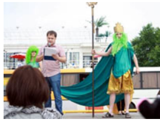
海の神ポセイドンから歓迎を受ける